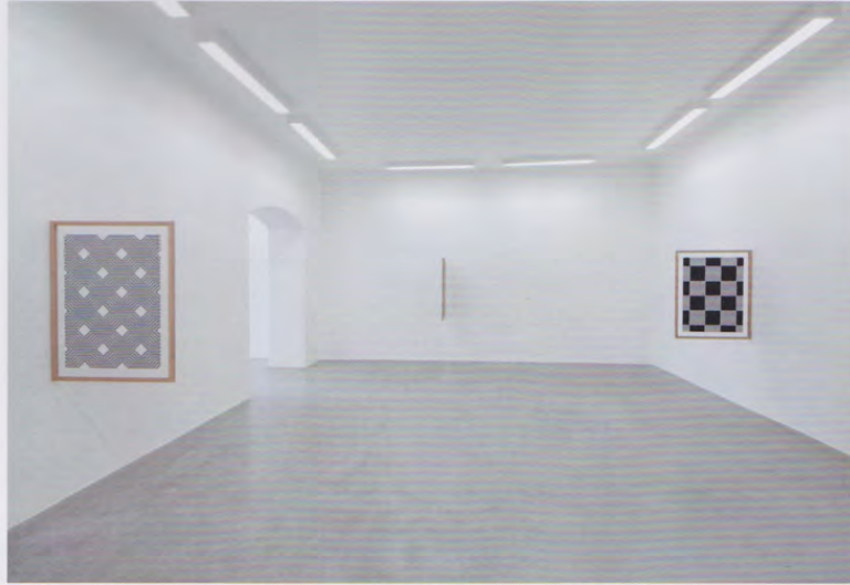
Effets d'optique déroutants, c'est la marque de fabrique de l'artiste.